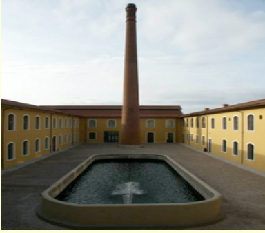
La Cimatoria Campolmi Museo del tessuto, uno dei saloni