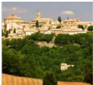
Veduta di Cingoli