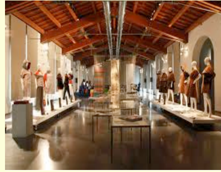
tessuto di seta