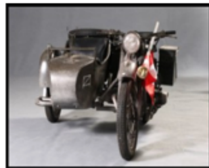
Il sidecar del film "L'Ultima Crociata"