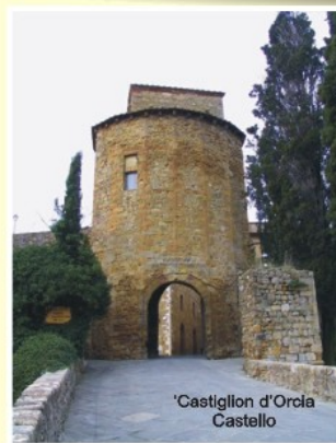
Castiglion d'Orcia Castello