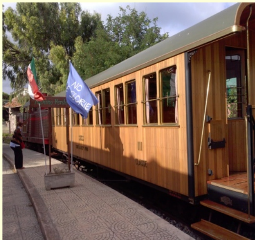
Trenino Verde Bosa Marina - Macomer