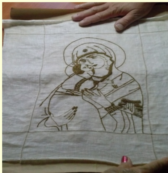
Riproduzione dell'Icona della Madonna di Vladimir (Vladimirskaja) eseguita in bisso. Questa Madonna è patrona della Russia