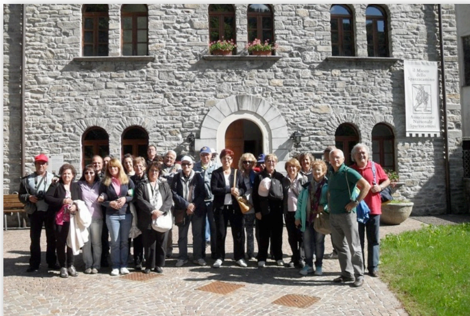
Raduno Valli Ossolane