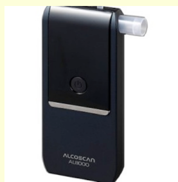
Etilometro portatile AL-8000 con boccali di ricambio